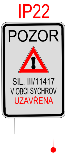
IP 22, upozornění na uzávěru v obci SYCHROV

Umístění nového dopravního značení je pouze orientační. Přesné umístění určí odpovědná osoba dle místních poměrů.